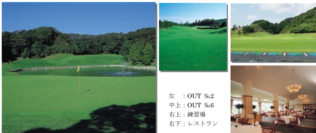
左 : OUT No.2 中上 : OUT No.6 右上 : 練習場 右下 : レストラン