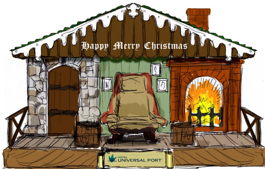
サンタのログハウスイメージ