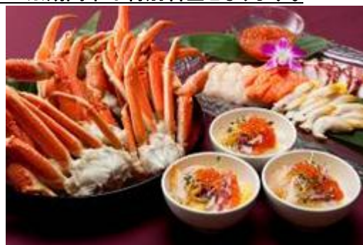
ズワイ蟹や海鮮丼