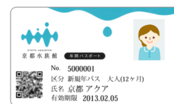
大変お得な年間パスポート

年間パスポート会員のお客様により深い満足感を感じていただくため、『京都水族館』は今後も年間パスポート会員様向けのイベントやサービスを、継続して行ってまいります。