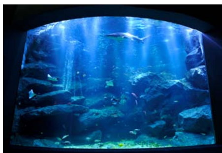
いのちのゆりかご・水の恵み～東京大水槽～

「すみだ水族館」を題材にした絵入り葉書には、世界自然遺産である小笠原諸島の海を再現した「東京大水槽」のほかに、館内で人気の「マゼランペンギン」も登場し愛嬌を添えています。