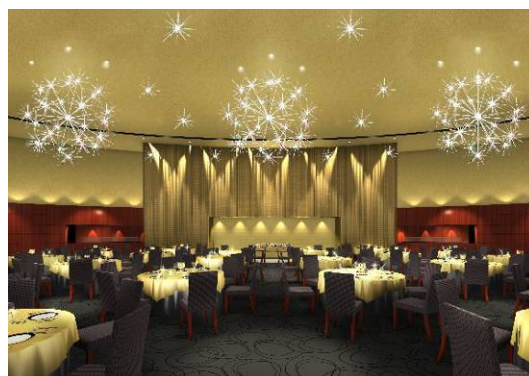
THE OVAL PALACE のイメージ