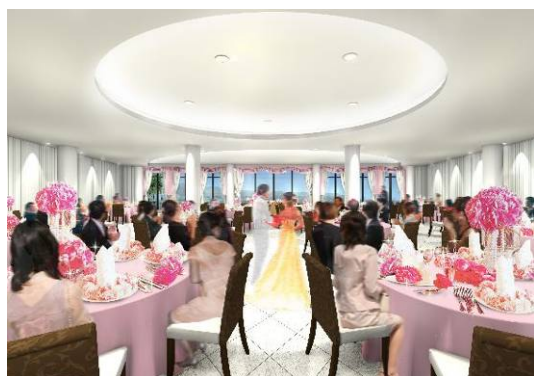
THE SUITE TERRACE のイメージ