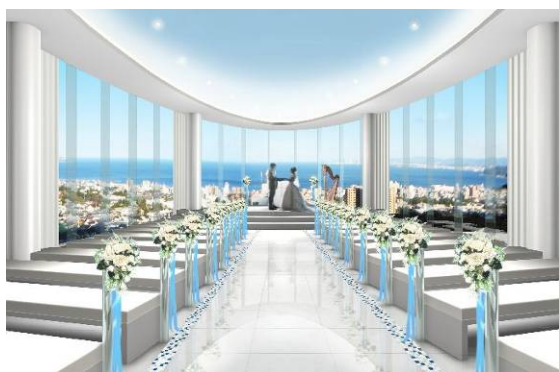
“Chapelle de aquamarine”のイメージ