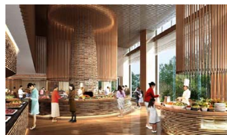
バイキングレストランイメージ

また、サラダアイランドには、‘体に優しいメニュー’をコンセプトに、‘野菜王国’といわれ、全国の料理人から高い評価を得ている長野県南佐久郡川上村産の高原野菜を中心に 15 種類の野菜と 12 種類のドレッシングをご用意し、さらに、信州オリジナル食材の「信州サーモン」や「信州地鶏」を取り入れた料理など、地元の食材にこだわった約 70 種類のメニューをご提供します。また、オープンキッチン形式を採用し、シェフの料理を間近で見たり、会話したりしながら、出来たての料理を楽しんでいただけるライブパフォーマンスコーナーや、ブッフェテーブルを低くしたキッズメニューコーナーを設けるなど、あらゆるお客さまにお食事を楽しんで