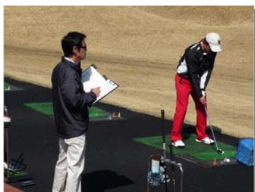
◀ プレー前に 練習場でスイング を確認・分析

なお、フィッティング料は無料ですが、プレー料金とクラブ製作代は別途必要となります。自分のスイングを最大限生かすクラブを手に入れるべく、この機会にぜひご利用ください。