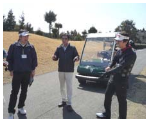
▶ ラウンド中にも ヒアリングを 行い、サンプル クラブを試打