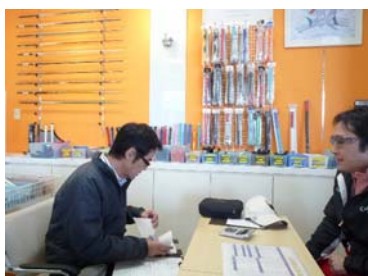
▲ プレー後、診断結果を元に相談