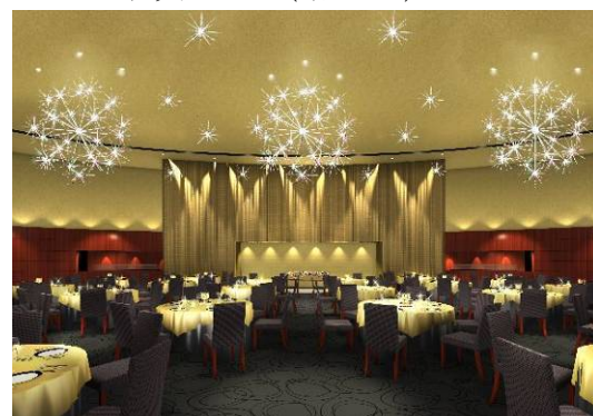
2F バンケットルーム(イメージ)