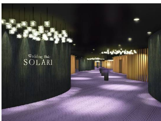
1F ブライダル棟ロビー(イメージ)