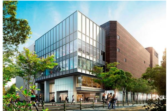
『オリックス劇場』イメージパース