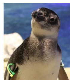
今年生まれた「ぼんぼり」(オス)

2021年5月6日（木）に生まれた「ぼんぼり」は、育ての親である「ポテチ」と「リンゴ」にとっても過保護に育てられ、0歳でありながら体重も全49羽の中でトップ5に入るほどに成長。大人たちと暮らす環境にもすぐになじみ、歳の近いペンギンたちと友達になったり、大人たちからゴハンを横取りしたりと元気いっぱい。今後の成長も楽しみなルーキーにご注目ください。