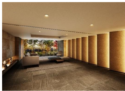
エントランス（イメージ）

「サーパス高崎連雀町」は、JR「高崎」駅および上信電鉄「高崎」駅より徒歩9分、高崎城の正門へ続く大手前通りに隣接する、高崎の中心地である連雀町に位置します。「高崎」駅は、上越新幹線、北陸新幹線をはじめ9路線が乗り入れする主要ターミナルとして、東京駅まで直通50分と都心へのアクセスも良好です。