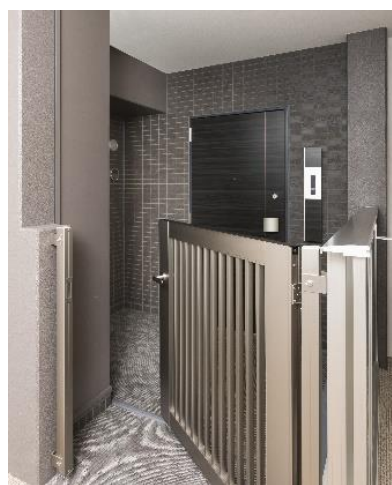
玄関ポーチ (イメージ)