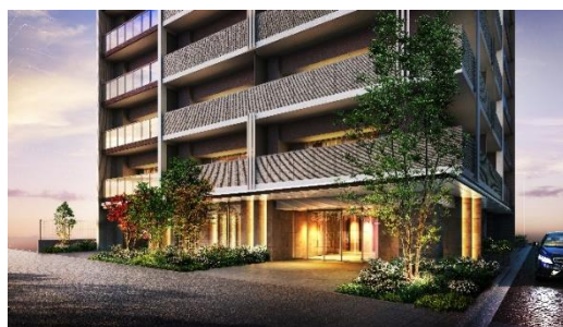
エントランス外観（イメージ）

アースカラーを基調とした外壁には、バルコニーを仕切るマリオンが交互に連なりアクセントになっています。エントランス部分はダウンライトによる光の演出により、訪れる方々を上質な雰囲気でお迎えします。