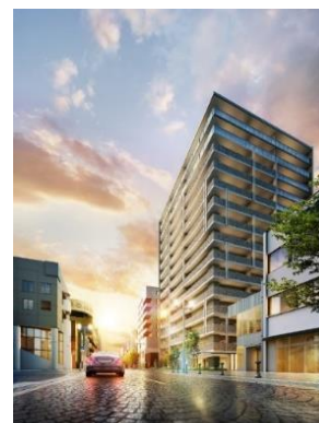
大手前通り沿いの外観イメージ

「サーパス高崎連雀町」は、高崎城正門に続く由緒ある「大手前通り」沿いに位置します。近隣には、老舗百貨店「スズラン百貨店」や、飲食店や美容院、ブティックなど多彩な店が軒を連ねる「大手前慈光通り商店街」など、商業店舗も充実しています。また本物件から約200m先にある高崎城址には、市役所や図書館、音楽ホールなどの文化施設、公園や学校などがあり、生活に必要な施設が身近に備わった住環境です。