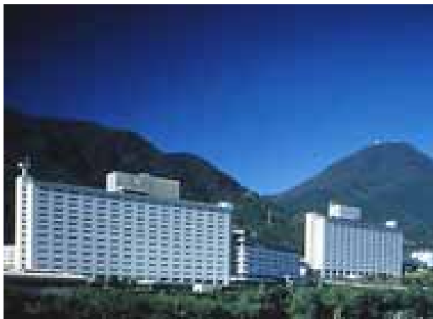
【杉乃井ホテル 全景】