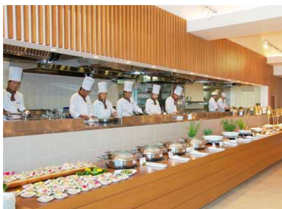
【バイキングレストラン Seeds (シーズ) 2008年7月19日 リニューアルオープン】