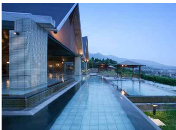
【大展望露天風呂「棚湯」】