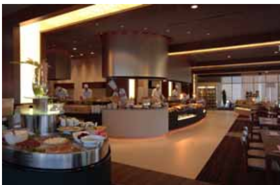
バイキングレストラン

機能性を兼ね備えたオープンキッチンを配し、目の前で料理人が作り上げるお料理を、五感でお楽しみいただける空間です。