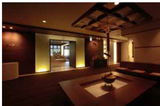
バイキングレストラン入口