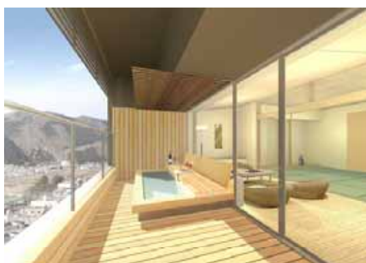
足湯付客室完成イメージパース

また、内 2 室は隣りあった洋室と和室が接続可能なコネクトルームとなっており、二世帯、三世帯でのご旅行や、お仲間同士でのご宿泊にも利用いただける仕様となっています。