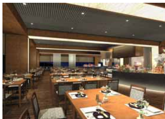
バイキングレストラン完成イメージパース

機能性を兼ね備えたオープンキッチンを配し、目の前で料理人が作り上げるお料理を、五感でお楽しみいただける空間です。