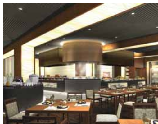
バイキングレストラン完成イメージパース