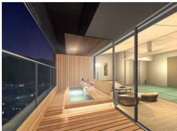
足湯付客室完成予想パース

紅葉館7階の全客室(7室)に、露天足湯を新設します。家族や仲間同士で客室から広がる眺望を眺めながら、皆でゆったりと心ゆくまで鳴子ホテルのお湯を堪能いただけます。