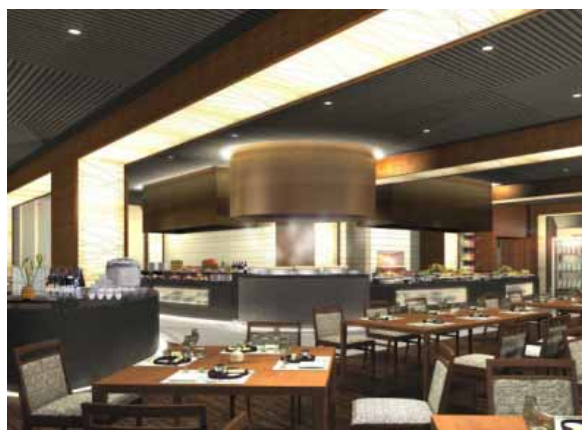
バイキング会場完成予想パース

従来の会場を拡張して、機能性を兼ね備えたオープンキッチンを新設します。より食事を楽しんでいただける雰囲気生まれ変わった空間で、地場産の新鮮食材で作られたお料理を心ゆくまで楽しみいただけます。