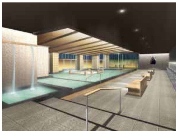
「芭蕉の湯」完成予想パース

当ホテル自慢の湯が一層引き立つような内装に一新いたします。更に照明にもこだわり、ゆっくりと寛ぎの時間を堪能していただける空間生まれ変わります。改修工事中も変わらず鳴子ホテルのお湯を楽しんでいただけるよう、新たな大浴場も新設します。