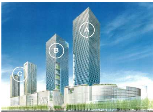
梅田北ヤード開発・全体完成予想図

2006年6月、大阪最後の一等地と呼ばれる大阪駅北地区「梅田北ヤード」の大規模開発プロジェクトの事業者に選定されました。