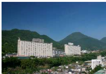
2002年9月 大分県別府温泉「杉乃井ホテル」

・大分県「杉乃井ホテル」、静岡県「大月ホテル」、福島県「御宿東鳳」、宮城県「鳴子ホテル」計 4 つのホテルを再生支援中。