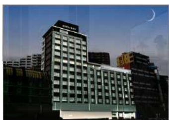
2005年12月 静岡県熱海温泉「大月ホテル」 「ホテルミクラス」として、本年リニューアルオープン