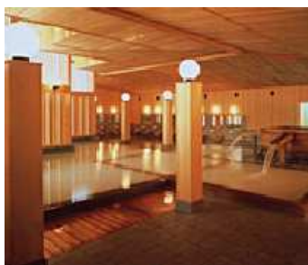
2006年12月 宮城鳴子温泉「鳴子ホテル」