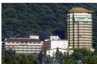
2004年6月 会津東山温泉「御宿東鳳」