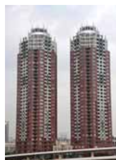
2004年分譲 港区「THE TOWERS DAIBA」 港区台場初の分譲マンション