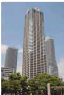
2005年分譲 大阪「クロスタワー大阪ベイ」 高さ日本一のタワーマンション