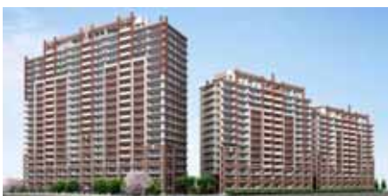
2006年分譲 千葉県流山市「ザ・フォレストレジデンス」 つくばエクスプレス「流山おおたかの森」駅前複合開発事業