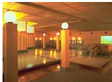
鳴子ホテル「玉の湯」

温泉郷の高台に建つ『鳴子ホテル』は、明治6(1873)年に創業、133年の歴史をもつ老舗ホテルとして親しまれている。館内に3つの源泉をもち、泉質の異なる湯をかけ流しで楽しむことができる。