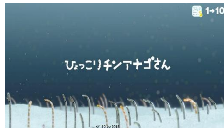
「ひょっこりチンアナゴさん」イメージ

人の動きに合わせて変化する遊び心満載の仕掛けで、チンアナゴの暮らしを身近に体験することができます。