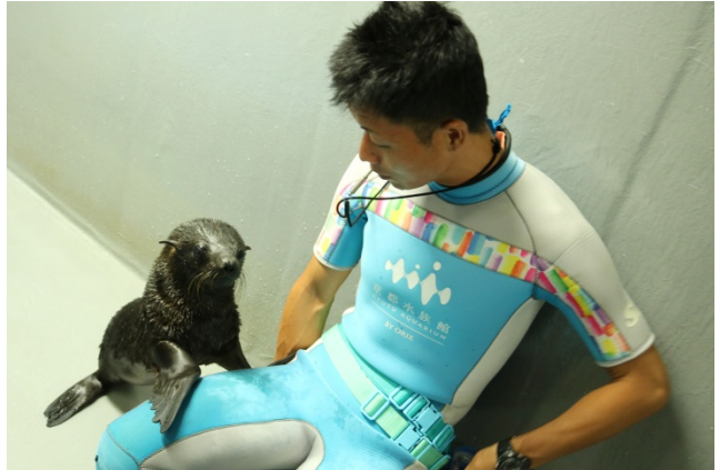
飼育スタッフに甘えるオットセイの赤ちゃん

特別公開「オットセイ赤ちゃんお目見えタイム」では、この時期ならではの赤ちゃんの愛らしい表情や甘えるしぐさなどを「オットセイ」「アザラシ」エリア内に特別に設置する展示スペースで間近にご覧いただけます。窓越しに中のようすをじっくりと観察でき、授乳などの母親の子育てのようす、飼育スタッフが日々成長を見守り飼育する姿などを観察することができます。