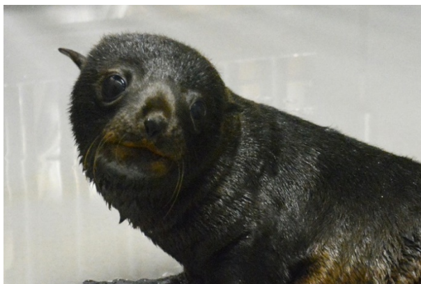
生後15日目のオットセイの赤ちゃん

京都水族館で誕生したオットセイは地元の京都の皆さまにも親しみをもっていただけるように「京都の遊び・祭り」を連想するキーワードから名前を付けています。これまで京都水族館で誕生したオットセイは、「あおば」（誕生月の6月に京都で開催される「青葉まつり」から連想）など、お客さまにご応募いただいた中から命名してきました。赤ちゃんの名前の発表は10月上旬を予定しています。