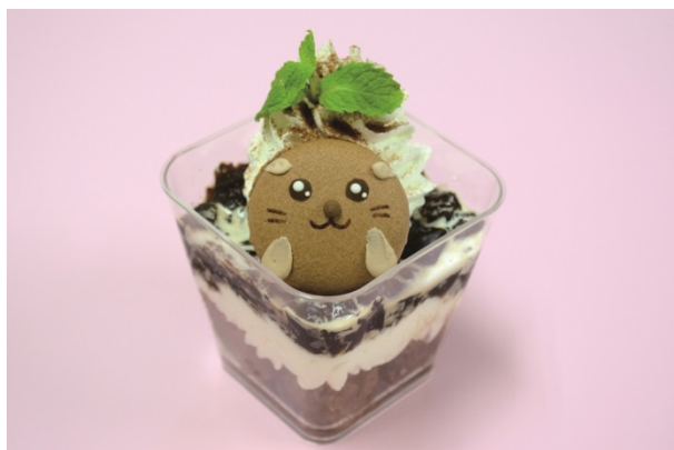
ハッピーオットセイパフェ（イメージ）

ミナミアメリカオットセイの赤ちゃん誕生を記念したコーヒーゼリーが入った期間限定のパフェ。上部にのっているマカロンはオットセイの赤ちゃんをイメージしています。