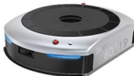
ピッキングロボット“EVE”（EVE800）

仕入れ商品の陳列やピッキングは、これまで作業員による手作業に拠っていたため身体的な負荷と作業効率の低さが課題でしたが、商品が並ぶ専用棚の下部に潜り込み、棚自体が作業員の待つワーキングステーションまで自動で移動する機能を持つピッキングロボット“EVE”の導入により、作業員の負担軽減が見込めます。さらに、省エネ設計により、30分の充電で10時間の稼働が可能で、手作業に比べて約3倍程度、作業効率の向上が図れます*。