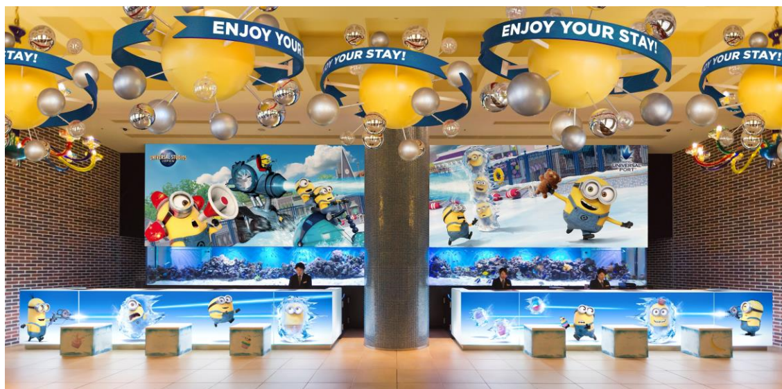
『ミニオン・ハチャメチャ・アイス・デコレーション』（イメージ）

ユニバーサル・スタジオ・ジャパン・オフィシャルホテル『ホテル ユニバーサル ポート』（所在地：大阪府大阪市此花区、総支配人：金井 紀生）は、2018年7月15日（日）より、パークの人気者「ミニオン」が繰り広げる、ハチャメチャで愉快的なロビー装飾「ミニオン・ハチャメチャ・アイス・デコレーション」を開始しました。