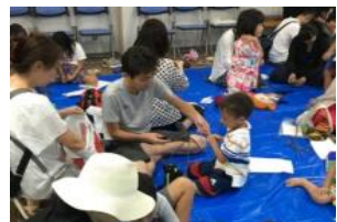
行灯をつくろう！イメージ