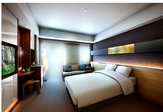
スーパーリア キング（30㎡）イメージ