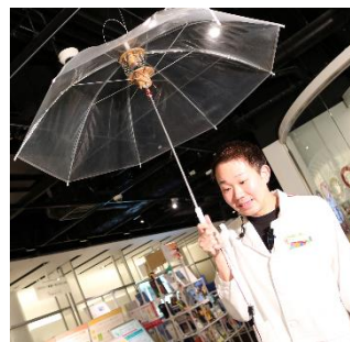
傘の柄を通して振動が伝わる