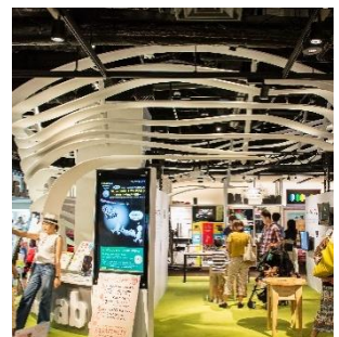
The Lab. みんなで世界一研究所

「アソブレラ」は「The Lab.みんなで世界一研究所」の参画者である「VisLab OSAKA」が、ナレッジキャピタル開業時より展示している「遠隔降雨感覚共有装置」です。