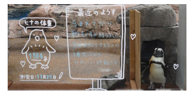
「ペンギンの赤ちゃん成長日誌」イメージ

赤ちゃんの誕生から成長を見守る飼育スタッフが、赤ちゃんのようすなど日ごろの想いを込めて書いた「成長日誌」を展示エリアに掲示します。