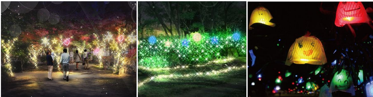
「京都・冬の光宴2018 Starlight Accessories～星屑のアクセサリー～」(イメージ)

京都・梅小路みんながつながるプロジェクトは、梅小路公園において冬のライトアップイベント『京都・冬の光宴2018 Starlight Accessories～星屑のアクセサリー～』を2018年2月2日(金)～2月14日(水)の期間に開催しますのでお知らせします。