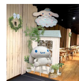
飲食スペースイメージ

※飲食は「山紫水明」エリアのカフェスペースがコラボレーションカフェスペースとなります。