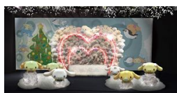
フォトスポットイメージ

シナモン約300体でつくる大きなハート型のフォトスポットがシーズンごとに登場します。また、シナモロールと京都水族館のいきものたちが季節ごとに登場する不思議なトリックビジョンで、ふわふわファンタジー空間を体感できます。