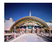
『サンリオピューロランド』

京都水族館とサンリオピューロランドの両施設にて、特典チラシを来場者に配布し、互いの施設で割引特典を受けることができます。※詳細は京都水族館公式ウェブサイトをご覧ください。