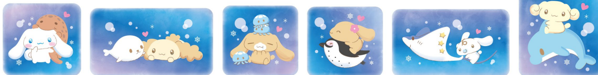
シナモンフレンズと京都水族館のいきものたち

いきものたちと仲良くなるためのアドバイスをシナモンフレンズが伝えます。「京の川」や「京の海」大水槽など6ヵ所の水槽をご覧ください。約15分に1回、メッセージボイスが流れます。