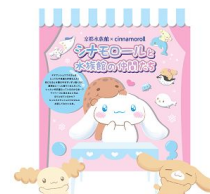
スタンプ台イメージ

シナモンフレンズが友達になった京都水族館のいきものたちの魅力を紹介し、館内6ヵ所にあるオリジナルのシナモンフレンズのスタンプを集めるスタンプラリーです。飼育スタッフとの愛情あふれるやりとりなど、いきものたちをもっと好きになることができるスタンプラリーをお楽しみください。