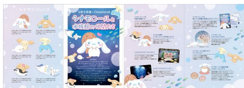
「シナモンフレンズの京都水族館ガイド」イメージ

シナモンフレンズがナビゲーターとなり、シナモンたちが京都水族館にやって来たオリジナルストーリーをはじめとした見所を紹介するガイドを来館者全員に配布します。イベントがさらに楽しめます。