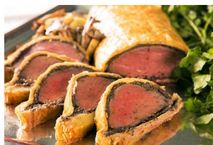
牛フィレ肉のパイ包み焼き