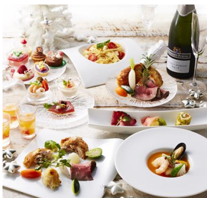
ローストビーフとクリスマスフェア (イメージ)

ローストビーフ、ローストチキン、国産骨付き豚バラ肉のロースト、ローストターキーのペペロンチーノ、サーモンとクリームチーズのパイ包み焼き、魚介類のナージュ仕立て、まぐろのカルパッチョ トリュフ風味、ずわい蟹とカリフラワーのムース、クリスマスケーキ、ブッシュドノエル など