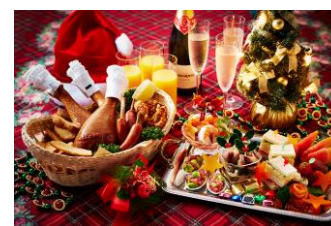
オードブル 8種/ビッグチキン/スモークターキーレッグ/骨付きフランク/フライドポテト

その他、クリスマスケーキ付プラン、シャンパン&オードブル付プランなど、多彩なクリスマス限定宿泊プランを販売します。