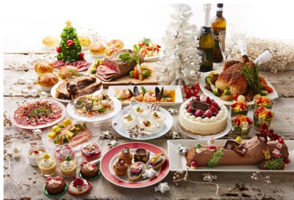
ディナーバイキング 「ローストビーフとクリスマスフェア」イメージ

宿泊プランは、毎年大人気の“サンタクロースがお部屋を訪問する”スペシャルプランをはじめ、パーティ料理やクリスマスケーキをセットにした企画をご用意しました。最上階 PORT DEEP OCEAN FLOOR の特別室「プレミアムパレス」には、フロアテーマ「深海」をイメージした高さ約2mのクリスマスツリーがきらめき、神秘的な海底のクリスマスを演出します。