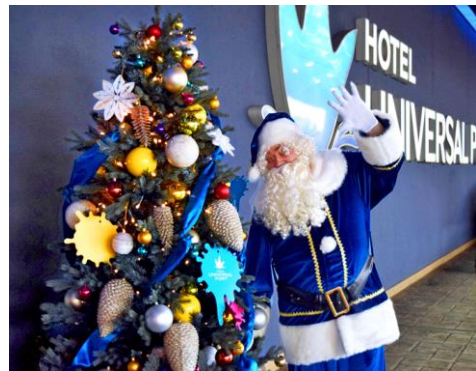
2016年「サンタグリーティング」より

11月10日（金）～12月25日（月）の期間、ロビーやエントランスにイエロー&ブルーのオーナメントがきらめくクリスマスツリーが並び、ロビー中央の高さ約3mの「ゴールドツリー」が華やかにクリスマスを彩ります。また、12月22日（金）からはポートのイメージカラーである“ブルー”の衣装をまとったサンタクロースが登場し、一緒に記念撮影できる「サンタグリーティング」を実施します。