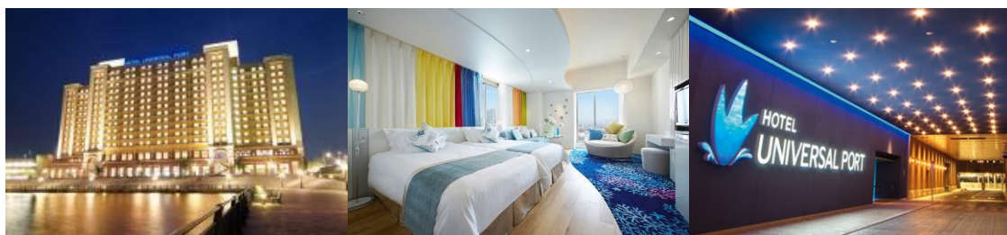
TM & © 2017 Universal Studios. CR17-3225