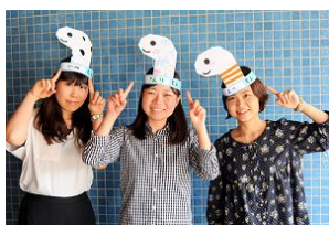
みんなでチンアナゴになりきろう！

チンアナゴになりきることができるお面を2日間限定で来館者に配布します。お面は好きな模様や色を塗ってオリジナルのお面を作ることができます。