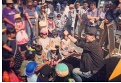
「魔法の家」イメージ