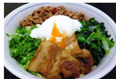
「YUM YUM MARKET (ヤムヤムマーケット)」イメージ

※店舗一覧および出展日程については「京都・梅小路みんながつながるプロジェクト」ウェブサイトをご覧ください。