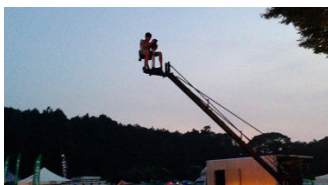
「クレーン体験」イメージ

映画を撮影する際に高い視点からの撮影で使用するクレーンが登場し、実際にクレーンに座ってカメラマンの気分を味わうことができます。映画の世界を体感できるとともに、梅小路公園周辺の景色をいつもと違った視点で楽しむことができる希少な体験です。