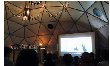
「太陽と星空のシアター」イメージ

※各作品の上映スケジュールについては「京都・梅小路みんながつながるプロジェクト」ウェブサイトをご覧ください。