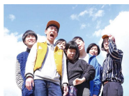
バレーボイス (10月8日)