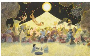
「太陽と星空のサーカス」