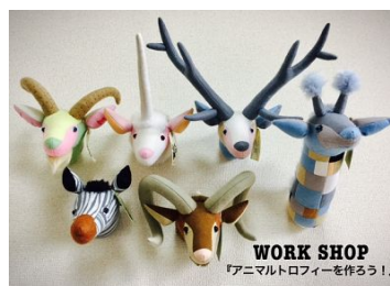
「遊ぶの教室」イメージ