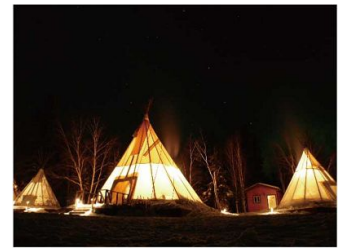
ティピテントイメージ

シアターのまわりの芝生には複数のハンモックを設置し、ごはんを食べたりお昼寝をしたりといった、イベントの雰囲気味わいながら公園の自然の中でゆったりとくつろげるエリアです。