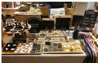
「ワンダーバザール」イメージ

期間中入れ替わりでさまざまな店舗が出店する蚤の市「ワンダーバザール」では、アクセサリーや布小物、アンティーク家具などの選りすぐりの品が集まります。「遊ぶの教室」では「遊ぶ・楽しむ・作る」というコンセプトのもとワークショップを体験できます。さらに、「ヤムヤムマーケット」は、こだわりの手作りパンや焼き菓子屋など、毎日違うさまざまなおいしいごはんのお店が連なり、一日中楽しむことができます。