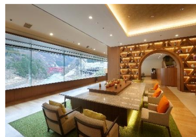
カフェラウンジ「樺-KEYAKI-」