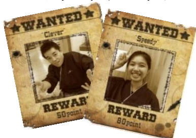
■スタッフウォンテッド