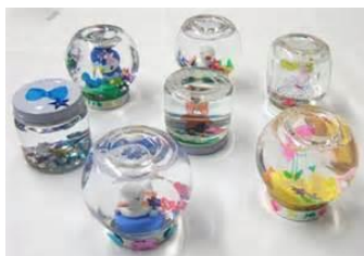
■スノードームづくり