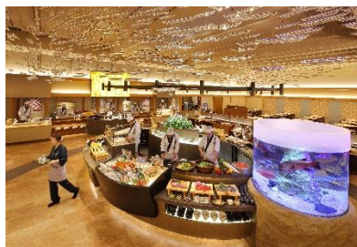
バイキングレストラン「Seeds」