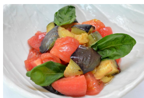
賀茂なすとトマトのイタリアンマリネ