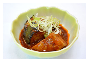
賀茂なすのマーボー風

販売価格 : デリプレートランチ(冷製デリ 2 種、温製デリ 1 種) 1,000 円(税込み)