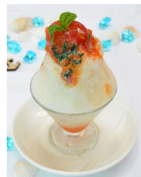
賀茂トマトとバジルの練乳がけ氷

見た目にも涼しげな夏限定のスイーツ「涼を感じるかき氷」を 2017 年 7 月 1 日(土)より販売します。京野菜である完熟の賀茂トマトとさわやかなバジルの風味が重なり合い絶妙な味わいを生む「賀茂トマトとバジルの練乳がけ氷」やマンゴーの果肉を大きくカットしマンゴープリンも一緒にお楽しみいただける「マンゴーかき氷」の 2 種類です。