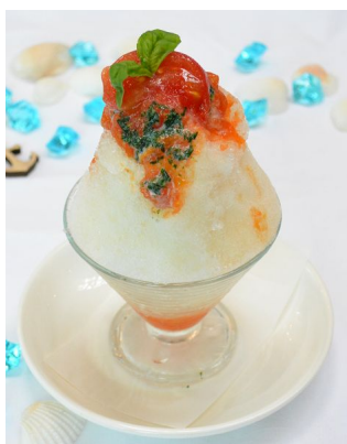
賀茂トマトとバジルの練乳がけ氷