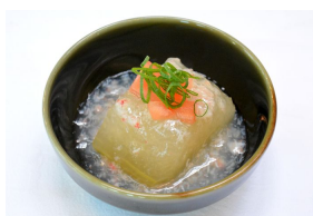
冬瓜ズワイガニあんかけ