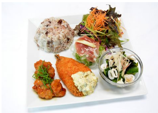
デリプレートランチ

複数の冷製デリと温製デリを自由に選ぶことができる「デリプレートランチ」に夏限定メニューが 2017 年 7 月 1 日(土)から 9 月 30 日(土)の期間限定で登場します。賀茂なすや枝豆、オクラや万願寺唐辛子といった夏に旬を迎える京野菜をたっぷり使ったデリをお楽しみいただけます。また、夏限定デリが組み合わさったボリューム満点の「夏のうめこうじ御膳」もどうぞお楽しみください。