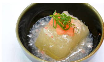
夏らしいデリ(惣菜)がそろいます