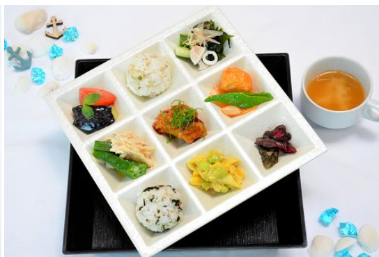
夏のうめこうじ御膳