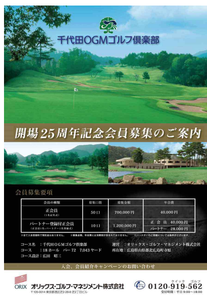
募集告知ポスター

OGMは、今後も「先進」「安定」「満足」の企業理念のもと、「1日を、大切にするゴルフ場へ。」をサービスブランドに掲げ、さらなるサービス向上に努め、ゴルファーの皆さまから、より一層愛されるゴルフ場を目指してまいります。