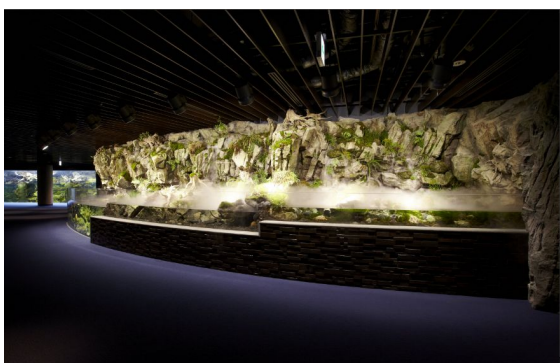
京都の河川にすむいきものを展示した「京の川」エリア

新展示では、鴨川源流域に生い茂る木々を配置し、その間から水槽にひそむオオサンショウウオの姿を垣間見ることができます。ゆっくりと足を進め、目の前に現れる水槽をさまざまな角度から覗くことで、オオサンショウウオが生息する自然に近い空間の中、その姿を間近でじっくりとご覧いただくことができます。