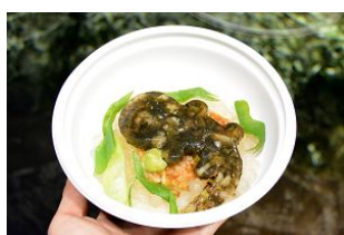
「オオサンショウウオ出汁茶漬け」