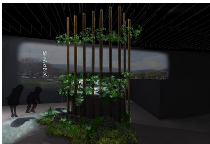
「京の川」エリアに登場する新展示(イメージ)