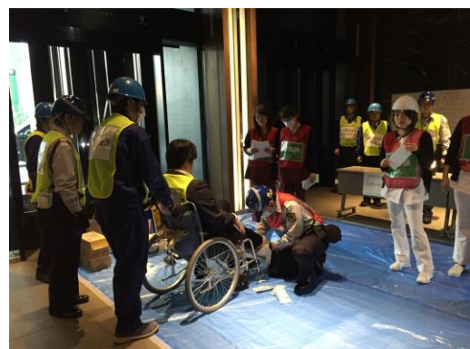
負傷者の搬送(南館)