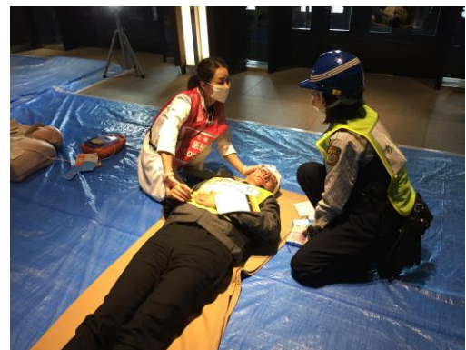
負傷者トリアージの実施(南館)