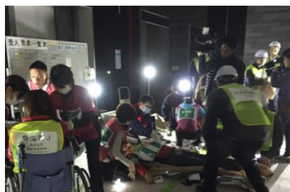
負傷者対応の様子（北館）