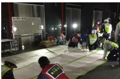
仮救護所立ち上げの様子（北館）

グランフロント大阪では、平素より非常用資機材の準備、食糧備蓄及び非常災害体制の編成等の他、大阪市北区からの要請を受け「津波避難ビル」の指定受け入れ等、ハード・ソフトの両面での災害対策を講じています。今後とも大阪市・所轄消防署や各テナント企業の皆様の協力のもと、非常時にも十分な体制を構築できる安全・安心なまちづくりを目指して参ります。