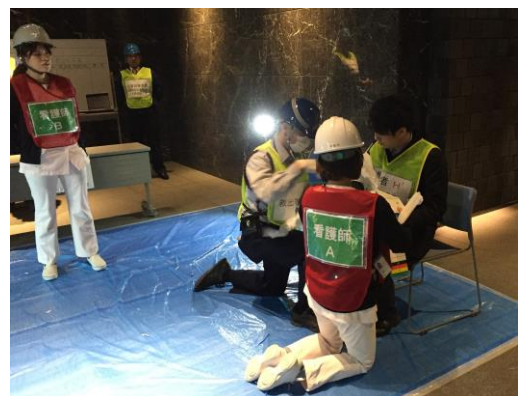
負傷者対応の実施(南館)

【本リリースに関するオリックス不動産株式会社の問合せ先】 一般社団法人ナレッジキャピタル 担当:奥村 06-6372-6530