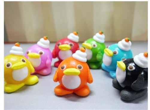
ペンギンガム お正月バージョン