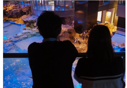
体験型福袋（イメージ）