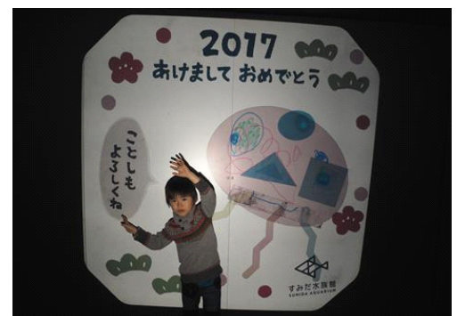
クラゲうつし～お正月限定 ver～

開催期間：2016年12月26日(月)～2017年1月9日(月・祝) 開催時間：10時00分～16時00分(最終受付15時30分まで) 開催場所：5F すみだステージ 参加対象：3歳以上 参加方法：当日受付 ※混雑時には整理券を配布する場合がございます。 参加料金：無料 ※入場料は別途必要となります。 参加定員：各日先着200名 ※定員になり次第終了 開催内容：透明の素材で自分だけのクラゲのオーナメントを作れます。お正月のフレームで飾られた壁面の大きなスクリーンに投影して遊んでみましょう。映し出された自分でつくったクラゲと一緒に記念撮影をすることもできます。