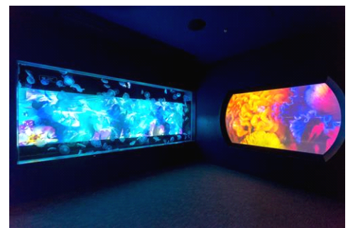
刻々と色彩を変える大型のクラゲ水槽