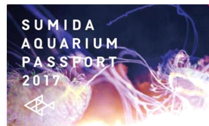
「蜷川実花×クラゲ」 オリジナル年間パスポート 2017