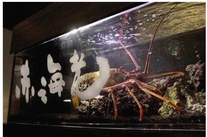
巨大なアカイセエビ(イメージ)

イセエビは長いひげや折れ曲がった腰から長寿のシンボルとされ、力強い甲冑のような姿や、厄を払う赤い色などの理由から縁起が良いとされるいきものです。その中でもアカイセエビは東京都が誇る世界自然遺産小笠原諸島などで漁獲され、一般的なイセエビと比較しても非常に大きく成長する種類です。今回展示するのは、体長が約40cm、触覚を含めた全長は約90cm、体重が約3.5kgのアカイセエビの中でも特大のサイズで、2016年に小笠原諸島で漁獲された中で最も大きい*とされる個体です。お正月にふさわしい堂々とした雄姿は縁起物と呼ぶにふさわしく、迫力満点です。