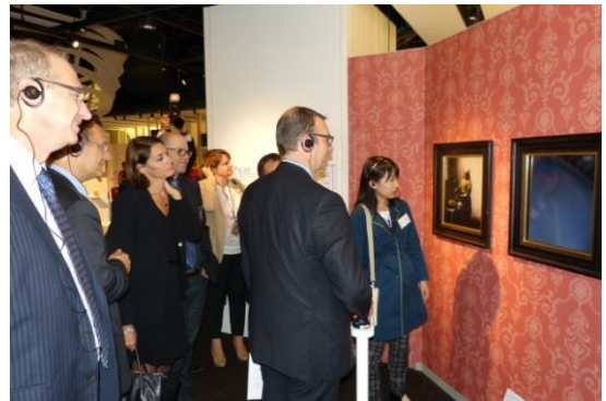
ナレッジキャピタル「The Lab.」を視察される御一行団

海外の各機関との連携構築による「国際交流」の実現を目指すナレッジキャピタルは、フランスで2番目の経済主要都市であるリヨン市と開業前から交流を深めてきました。