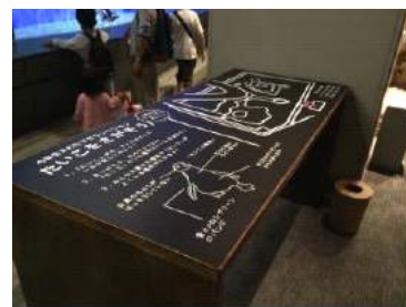
「ふうりん」ワッチ」イメージ