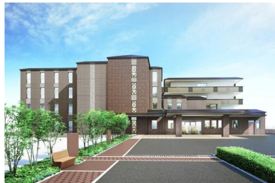
グッドタイム リビング 嵯峨有栖川