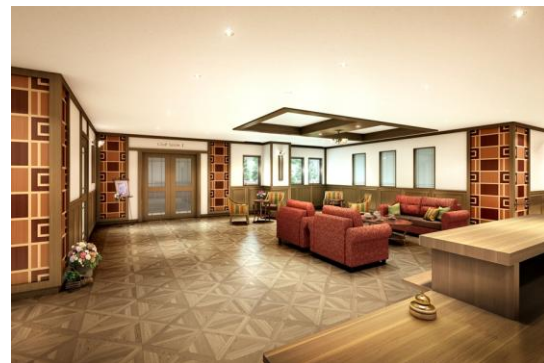
グッドタイム リビング 嵯峨有栖川 エントランスホール