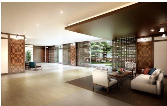
グッドタイム リビング 嵯峨広沢 エントランスホール