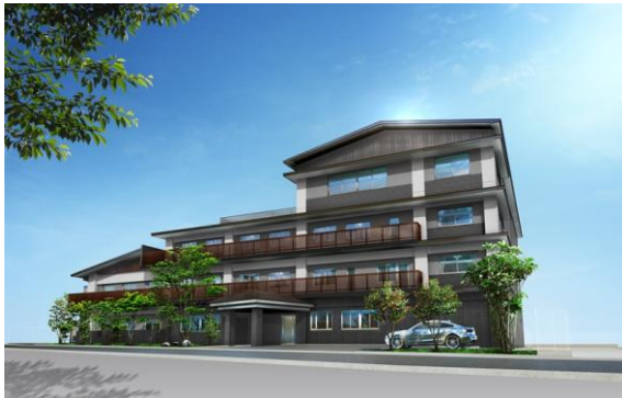
グッドタイム リビング 嵯峨広沢