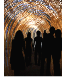
輝きの道イメージ

イルミネーションデザイン監修:照明デザイナー/NAIKIDESIGN INC.内木宏志