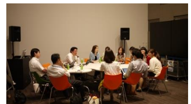
ナレッジサロン会員の意見交換の様子

大阪は天下の台所として、また関西文化の発信拠点として、経済的にも文化的にも日本の発展を支えてきました。「グランフロント大阪」は民間企業12社が開発・運営する日本でも類をみない複合施設です。その「グランフロント大阪」の中核施設「ナレッジキャピタル」も知的創造拠点として「人々のつながり」から生まれる新しい価値を発信しています。大阪で生まれて1年、「FIGS」は累計6万部を発行し、ちょっと贅沢な時間と、素晴らしい出会いをつなぐ愛される本になりました。