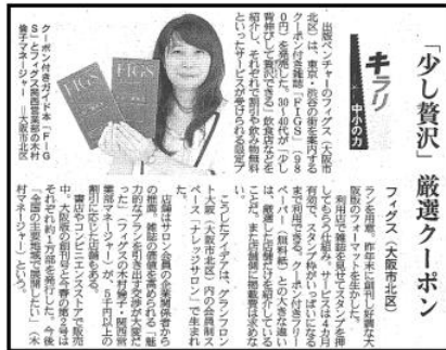
産経新聞朝刊 2015年6月18日 掲載