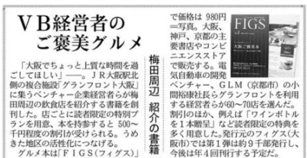
日本経済新聞朝刊 2015年5月19日 掲載