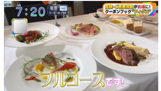
朝日放送 おはよう朝日です 2015年7月8日