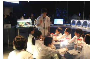
「クラゲ研究員」開催の様子

開催内容：飼育スタッフと同じ白衣を着て、クラゲについて研究するプログラムです。クラゲをより身近に感じることができます。