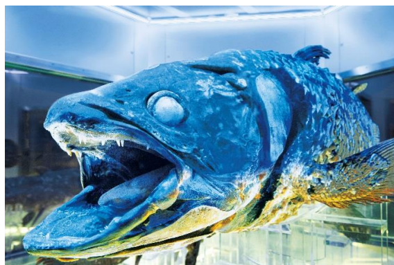
世界的に希少な冷凍シーラカンス