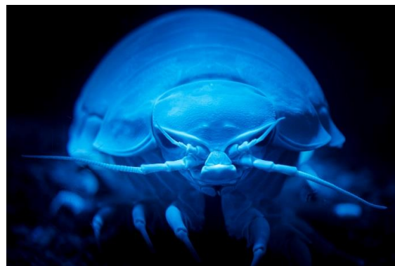
展示深海生物 ダイオウグソクムシ