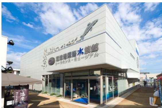
沼津港深海水族館外観