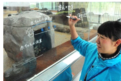
飼育スタッフが綴る赤ちゃんの成長記録