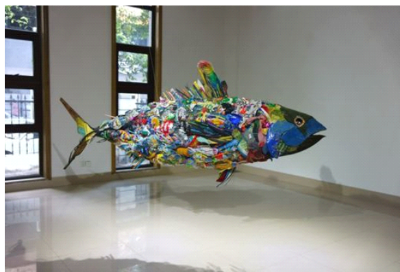
「淀川テクニック」によるゴミを再利用した大型作品『さざれ魚』