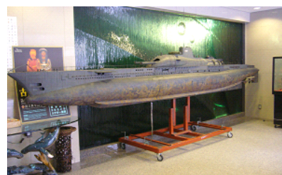
潜水艦「ローレライ」