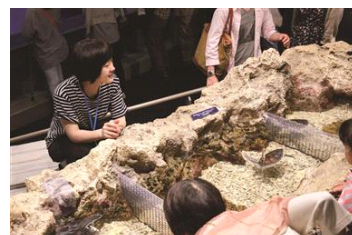
ウミガメアカデミー