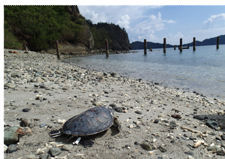
小笠原での放流の様子

また、『すみだ水族館』では、小笠原諸島の魅力を伝えるための取り組みとして、毎月26日に開催する体験プログラム「小笠原アカデミー～ゆうゆうオガサワラ～」を行っています。小笠原観光局のスタッフと『すみだ水族館』の飼育スタッフが、小笠原の自然・文化に関する旬な話題についてお話するとともに、落ち着いた夜の水族館で小笠原諸島の特産品であるラム酒を片手に、和やかな雰囲気で行う大人向けプログラムです。2015年8月26日(水)の「小笠原アカデミー～ゆうゆうオガサワラ～」ではアオウミガメを取り上げます。