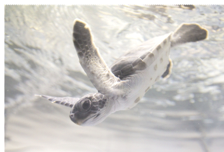
アオウミガメの赤ちゃん

小笠原諸島は国内有数のアオウミガメの産卵地で、現地での保全・放流活動が行われています。『すみだ水族館』は小笠原の活動に賛同し、お客さまにかわいらしい姿や希少性を伝えるため、2012年より、毎年小笠原諸島で生まれたアオウミガメの赤ちゃんをお預かりし、約1年間育て小笠原諸島の海へ放流する活動を続けています。昨年『すみだ水族館』でお預かりした6匹のアオウミガメは1年間で甲長が約9 cmから約25 cmに成長し、そのうち4匹を2015年8月2日(日)に飼育スタッフの手で放流しました(残りの2匹は今後放流する予定です)。そして、今回2015年7月18日(土)に小笠原で生まれた甲長約6 cmのアオウミガメの赤ちゃん5匹を『すみだ水族館』でお預かりし、2015年8月14日(金)より一般公開を開始します。