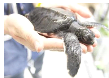
アオウミガメの赤ちゃん

展示生物：小笠原生まれのアオウミガメの赤ちゃん 展示場所：5F ウミガメアカデミー 展示期間：2015年8月14日(金)～来年、小笠原の海へ戻す日まで 展示数：3匹 甲 長：約6cm 展示内容：今年の7月18日(土)に小笠原諸島で生まれたアオウミガメの赤ちゃんを間近で見ることができます。飼育スタッフがいるときは、アオウミガメについて質問することもできます。今しか見ることができない小さくてかわいい赤ちゃんに、ぜひ会いに来てください。 ※展示内容は変更になる可能性があります。