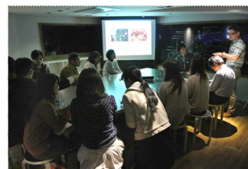
小笠原アカデミー ～ゆうゆうオガサワラ～

開催日時：2015年8月26日(水) 19時10分～19時50分 開催場所：5F アクアアカデミー 参加対象：20歳以上 参加費：無料 参加定員：8組16人 参加方法：公式ホームページにて募集 開催内容：小笠原村観光局員と『すみだ水族館』の飼育スタッフによる小笠原の自然・文化に関する旬な話題を、特産品であるラム酒を味わいながらお楽しみいただけます。まるで小笠原にいるかのような、ゆうゆうとした時間を過ごす大人向けプログラムです。今回は、アオウミガメをテーマに行います。