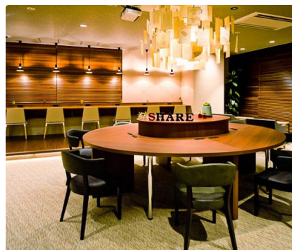
【クロスオフィス シェアオフィス渋谷】