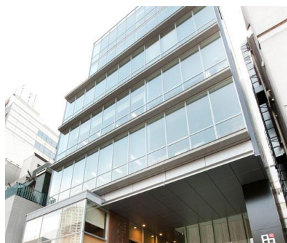
【クロスオフィス渋谷】

企業の成長スピードに合わせて面積の拡張も可能です。また、1名さまから利用できるシェアオフィスなどもあり、さまざまなニーズにお応えいたします。