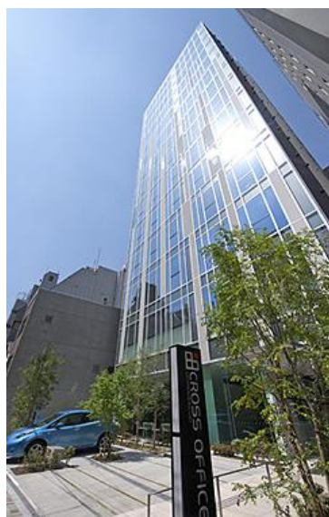
【クロスオフィス内幸町】