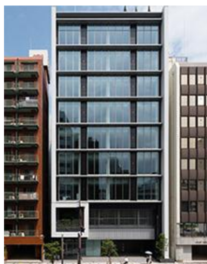
【クロスオフィス三田】