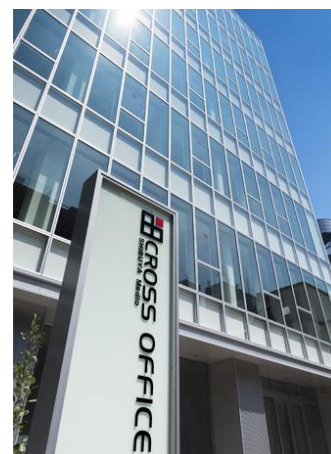
【クロスオフィスメディアオ渋谷】