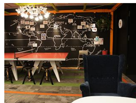
【クロスオフィス三田 ブースオフィス】