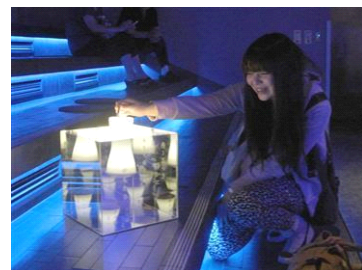
ほたるからのメッセージ

開催内容：期間中の18時30分より貸し出すLEDランタンを「江戸リウム」を中心とした館内各所に設置されているミラーボックスに入れると、「ほたるからのメッセージ」が浮かび上がります。「ホタルの光は冷光(れいこう) 熱くない光」「静かに燃える光もある」など、楽しみながらホタルの特徴を学ぶことができます。また、小さな容器内でのホタルの展示も行い、手に持ってじっくりと観察することができます。