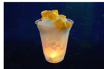
ほたるのひかりカキ氷

開催期間：2015年6月24日(水)～6月28日(日) 販売時間：各日18時30分～21時00分 商品名：ほたるのひかりカキ氷 販売価格：600円(税込) 商品内容：夕暮れの清流で光るホタルをイメージしたカキ氷。みぞれシロップとマンゴーゼリーで仕上げました。焼酎が入った大人向けのカキ氷650円(税込)も販売します。