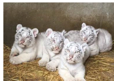
ホワイトタイガーの赤ちゃん

遊園地は、「リバティーランド」「プレジャーランド」「ハートフルランド」の3つのエリアにわかれており、バラエティーに富んだ30種類のアトラクションが楽しめます。そして、今年で25周年を迎える「東武スーパープール」では、新スライダー「タイガースブラッシュ」が登場します。