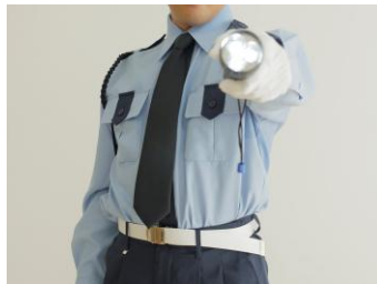
24 時間有人管理（夜間警備員）