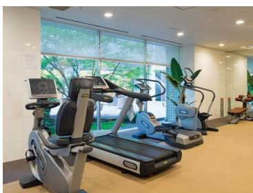
フィットネスジム