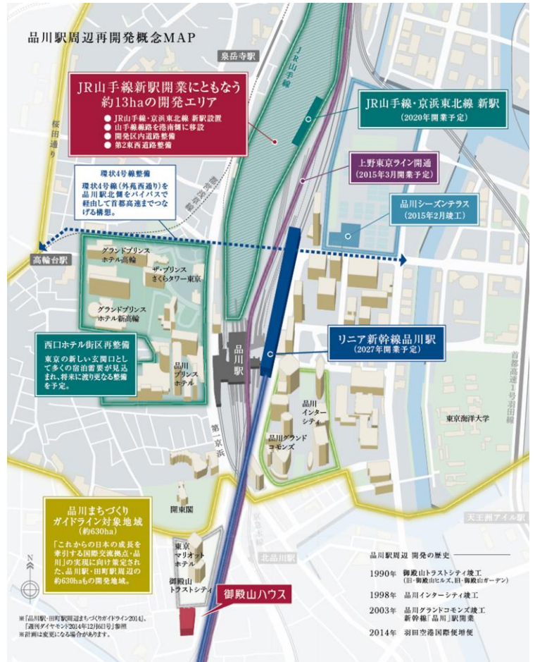
630haにも及ぶ再開発構想図