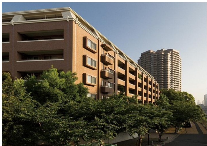
御殿山ハウス 東南側眺望写真

「御殿山ハウス」は、発展著しい品川エリアにおいて、「品川」駅徒歩圏ながら、周囲と一線を画す、落ち着いた住環境である高台の邸宅地「御殿山」に立地し、都心の利便性とプライベート感を享受できるゆとりある住空間を形成しています。この都心第一種低層住居専用地域にある「御殿山ハウス」の希少な価値を最大限に活用したリノベーションマンションの分譲を行います。